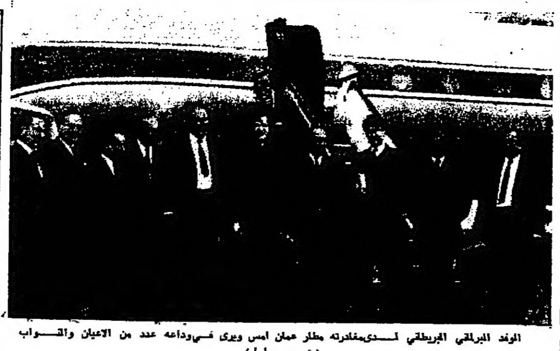
الوفد البرلاني البريطاني لسيد غافر عمن امس ويري في واديه عدد من الاميان والقناب